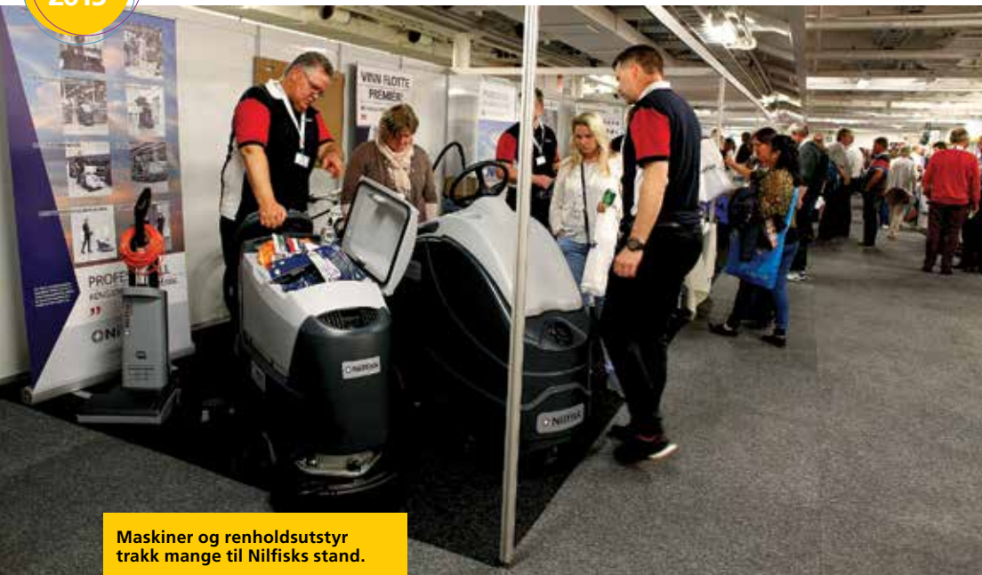
Maskiner og renholdsutstyr trakk mange til Nilfisks stand.