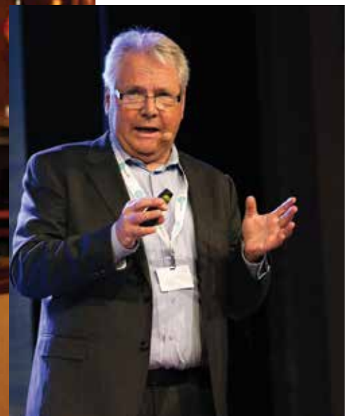
Byggdrifere må kreve å få være med på relevante møter, anbefaler Halvor Nerheim fra Boinnova.