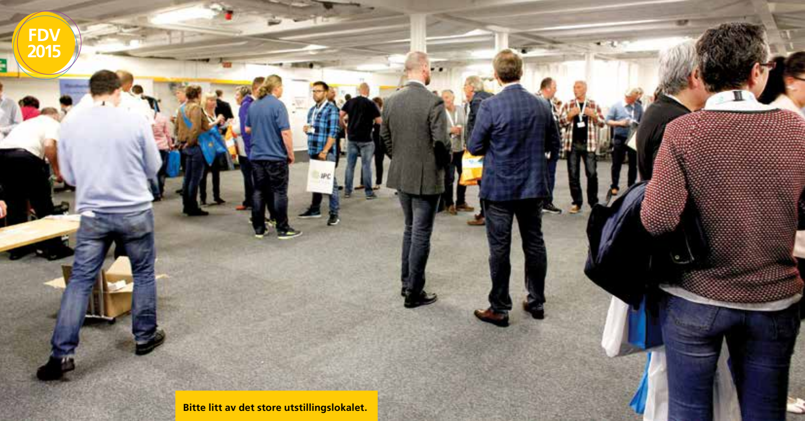
Bitte litt av det store utstillingslokalet.